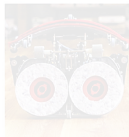
Haid-tec gibt für einen Satz der neuen MelaminPlusPads eine Flächenleistung von 10.000 Quadratmetern an.

Für die kompakte Scheuersaugmaschine NUC244NX von Numatic hat Haid-tec die MelaminPlusPads angepasst und optimiert. Die Pads haben genau den passenden Durchmesser, so kann die volle Arbeitsbreite ausgenutzt werden, wobei auch kein Streifen zwischen den Pads ungereinigt bleibt. Auch die Aussparungen im Schaumteil wurden exakt angepasst, damit ein vollflächiger Kontakt mit dem Bodenbelag gewährleistet wird und sich die Pads einfach montieren lassen. Zudem wurde der Fertigungsprozess optimiert. Durch die neue Melaminschaumkombination gelang es, die Standzeiten zu verbessern. Je nach Bodenbelag werden laut Hersteller Flächenleistungen von 10.000 Quadratmetern und mehr pro Padsatz erreicht.