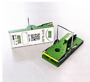
Schlagfallen von Gemex - ausgestattet mit LoRa-Funktechnologie.

Die Biozid-Verordnung hat die Verwendung von Bioziden stark eingeschränkt. Ebenso ist das Aufstellen von Schlagfallen nur im Zusammenhang mit einem vorausschauenden Schädlingsmonitoring erlaubt, die Tierschutzverordnung fordert deren tägliche Kontrolle. Für hygienessensible Bereiche mit großen Gebäuden hat